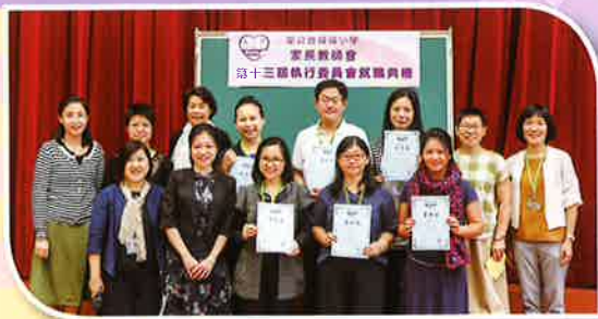
第十三屆家長教師會執行委員會委員架構