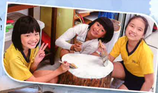
我們合力動手為木頭塗上新衣裳！

早前愉景灣受颱風吹襲，塌樹處處。視藝學會同學善用社區捐贈的塌樹木頭，發揮創意，在木頭上繪畫出圖案，為大樹賦予新生命。