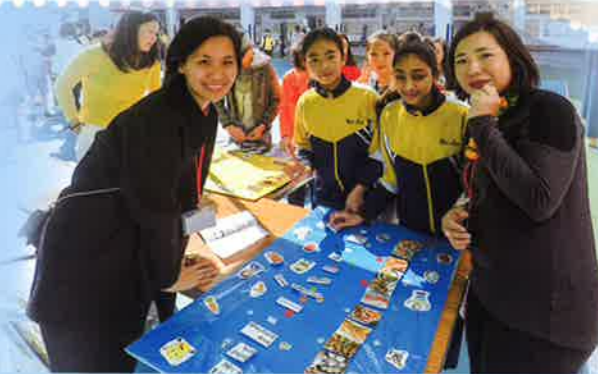
Matching foods from around the world.

For the 2018-2019 school year, our English Day theme was FOOD! English day was on 25th January 2019 and the students and teachers had a lot of fun. Students were able to join in many different booth games, a word hunt, quiz shows, and watch a drama performance, all about food!