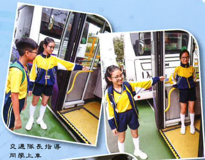
交通隊長指導同學上車

為了強化學生的領袖特質，本組邀請相關機構進行多次訓練，並舉行3日2夜領袖訓練營，相信此安排能更有系統地啟發領袖生的領導潛能。