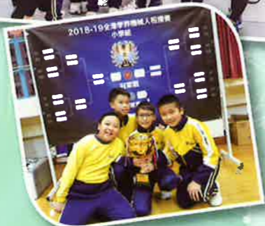
「YMHK 全港學屆機械人相撲賽」冠軍隊伍