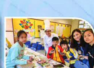
Making sushi is fun!