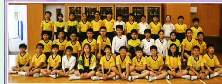
數學比賽代表隊 (高級組)