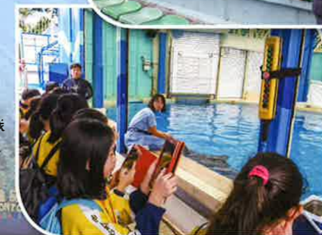
深入認識 海豚習性