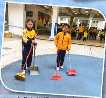
清潔大使開始工作！