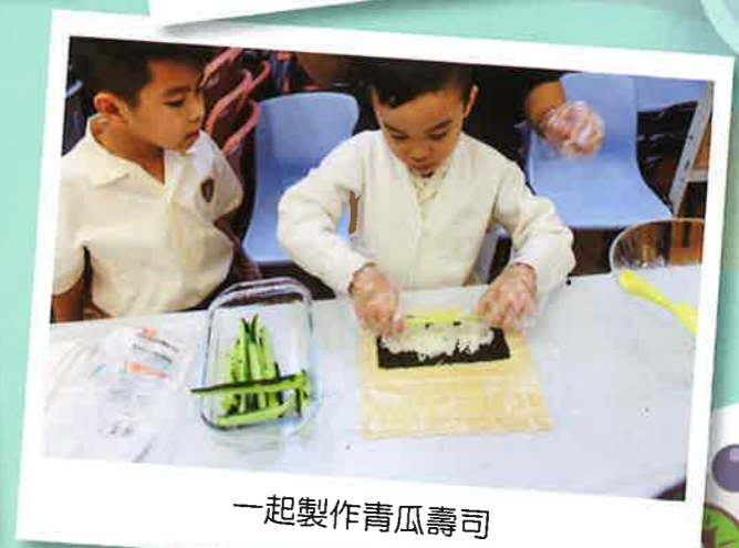
一起製作青瓜壽司