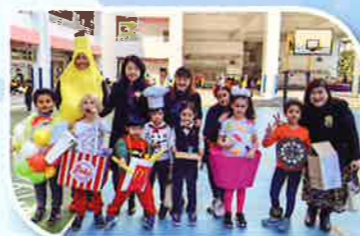
More fantastic costumes from the students. Great work!