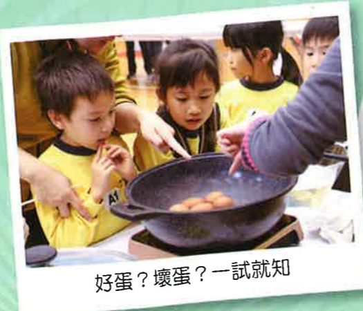
好蛋？壞蛋？一試就知