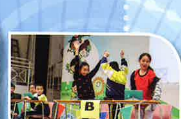
The P5 English Day Quiz Show winners!