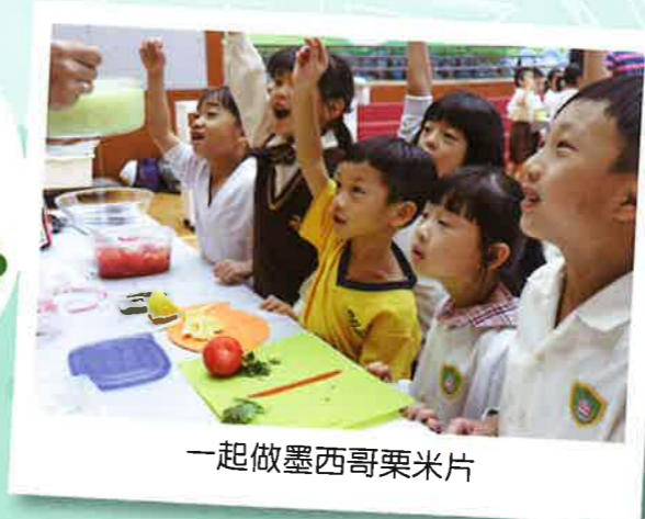
一起做墨西哥粟米片