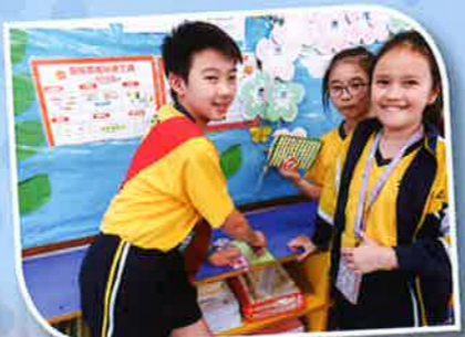
風紀為同學蓋三葉草印章，真開心！