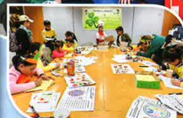
Students designed their own festival food.