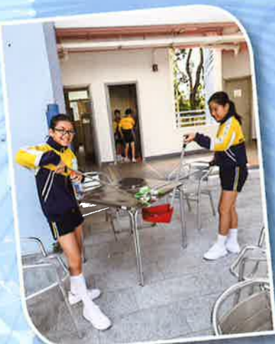
清潔大使努力為校園清潔，盡心盡力！