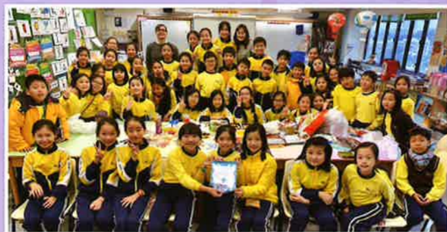
英詩集誦 (高級組) 冠軍