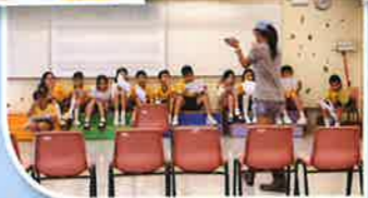
同學專心聆聽，學習演戲技巧。