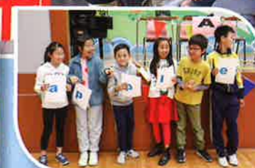
Spell that word!