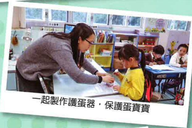
一起製作護蛋器，保護蛋寶