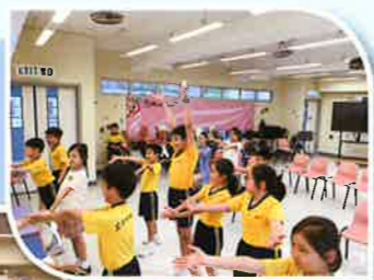
從演戲中，同學們培養自信心，在公眾面前演出。