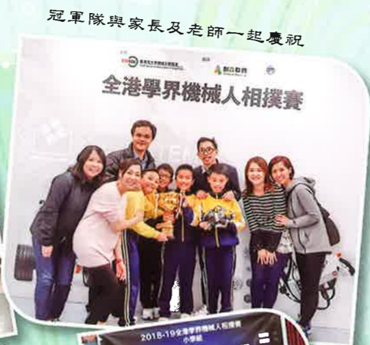
冠軍隊與家長及老師一起慶祝