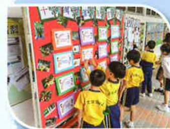
有關動物的「十萬個為甚麼？」