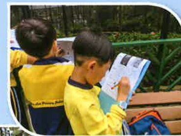
仔細觀察，用心記錄

為了讓學生更深入了解動植物知識及加強思考能力，一年級戶外學習活動首次邀請家長擔任動植物知識講解員。家長除了於活動當日擔任照顧者外，亦成為同學的「家長老師」，以小組的形式向學生講解動植物知識，並向同學作出高層次提問，引發他們思考。此外，高年級同學也為學弟妹於早會及小息時段預備了成果展示分享會。