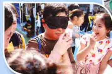
Guess that food! Blind taste testing on English day