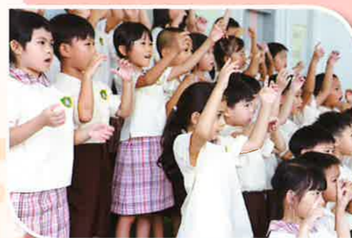
我們的第一次表演