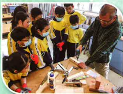
小小建築師用心學習