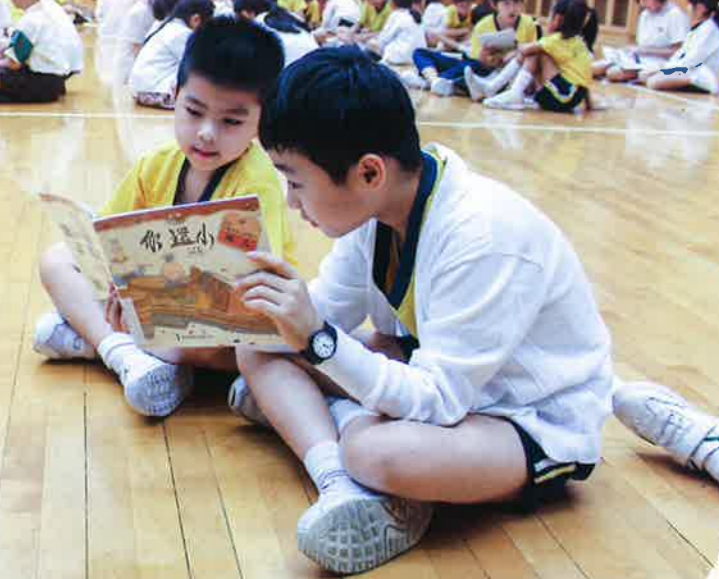
小一小五伴讀活動