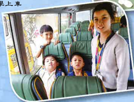
交通隊長指示同學上車回家