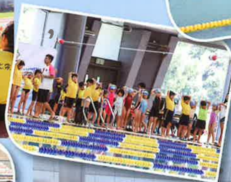
做好熱身力爭冠軍