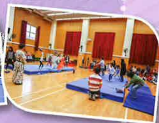
親子枕頭大戰 ~ 大人小孩樂在其中