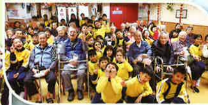
同學們樂於與長者談天，大家樂也融融，獲益良多。