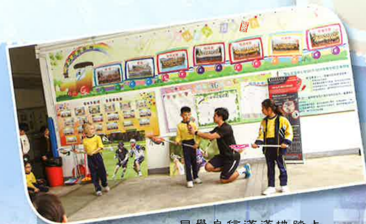
同學自信滿滿地踏上星光舞台

「星光舞台」是我校星期五的特備節目，同學在第一個小息時於有蓋操場的星光舞台向全校同學展示自己過人之處：有的展現運動技能，如曲棍球及跆拳道；有的表現音樂天份，如吹笛子、彈結他等。星光舞台讓同學在表演期間肯定自我，亦讓其他同學更認識自己。