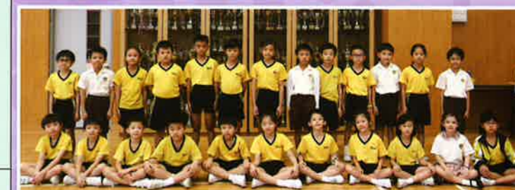
數學比賽代表隊 (初級組)