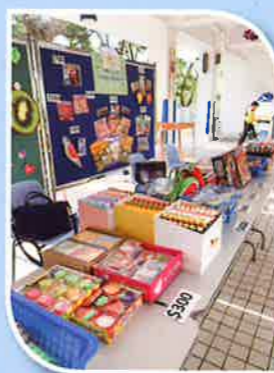
At the Wei Lun Food Market students could redeem their Food Festival Dollars for prizes.

Thanks to all of those parent helpers, English day was a success!