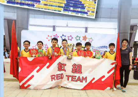
紅組(A班)奪得啦啦隊冠軍!!