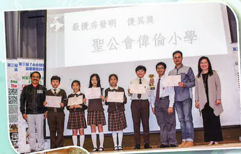
最優秀發明 優異獎