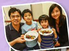
親子正念體驗營 ~ 體驗正念學習，促進親子關係