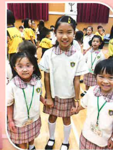
小一小五破冰活動