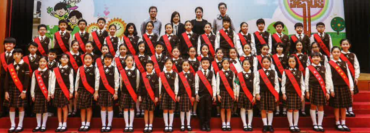
風紀大家庭成立了！