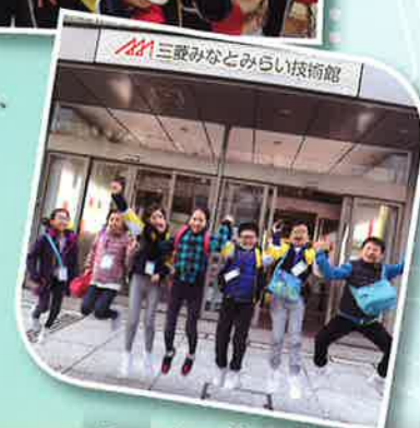
三菱重工未來技術館