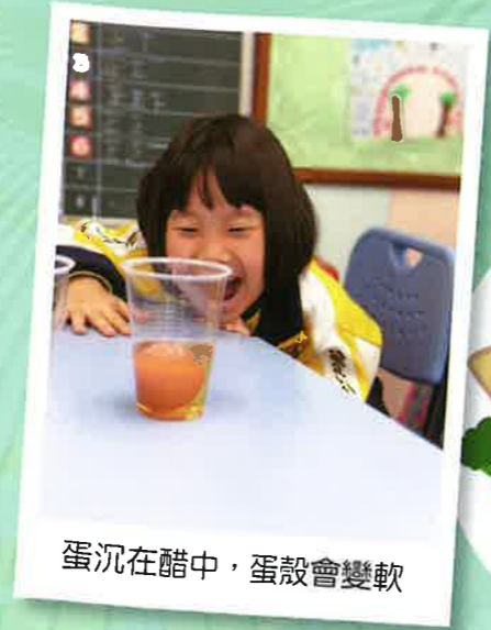
蛋沉在醋中，蛋殼會變軟