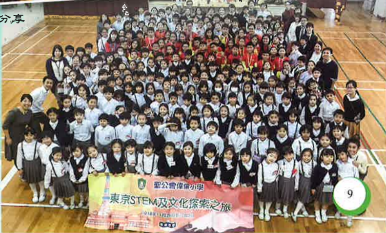
聖公會偉倫小學 東京STEM及文化探索之旅