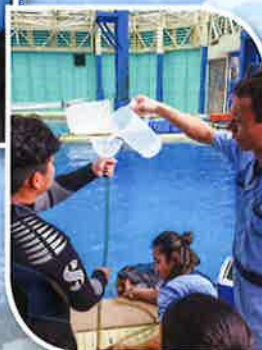
工作人員示範為海豚進行檢查