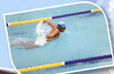
蝶泳姿勢無人能敵