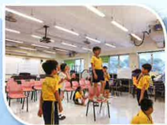
小演員一嘗當主角的感覺，十分興奮呢！

本年度是中文戲劇小組成立的第二年，成員們愈樂於表現自己，享受學習演戲的過程。在學習的過程中，同學們更會主動加入創意戲劇的元素，勇於表現自己，發揮潛能。