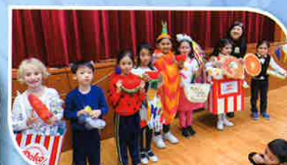
Some of the best costume winners for English Day!