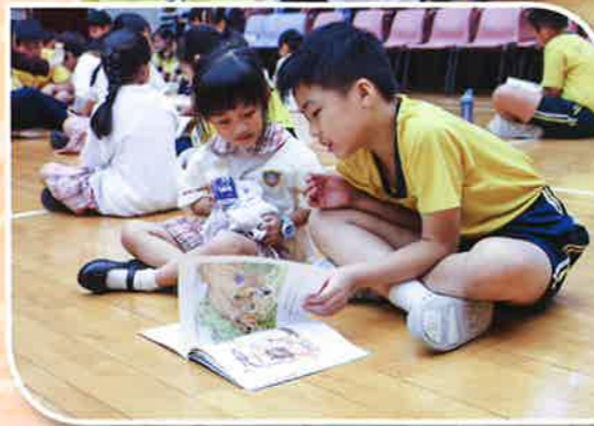
獨讀樂，不如眾讀樂