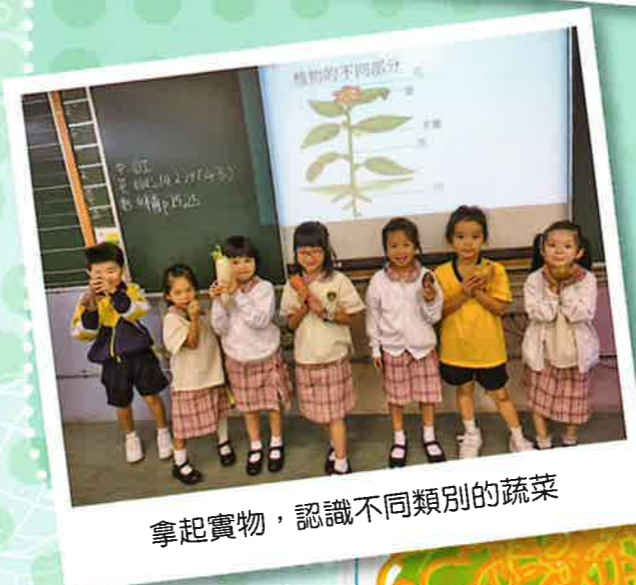
拿起實物，認識不同類別的蔬菜