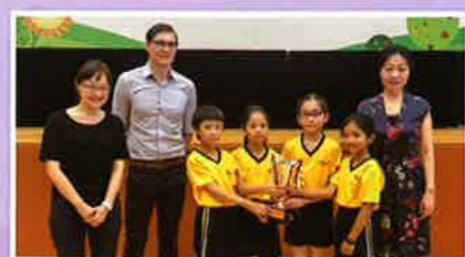
英國文化協會 English Master Junior 2019 最佳團隊獎