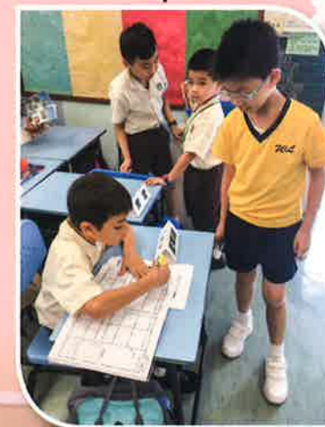
謝謝大哥哥的幫忙！